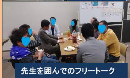
先生を囲んでのフリートーク